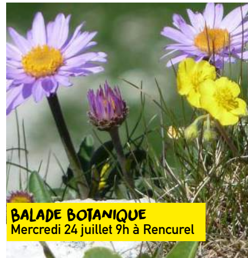
BALADE BOTANIQUE Mercredi 24 juillet 9h à Rencurel