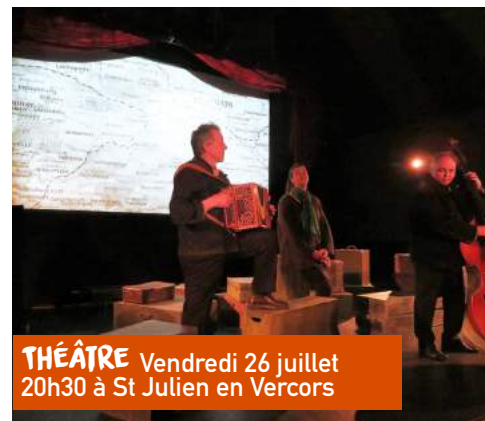
THÉÂTRE Vendredi 26 juillet 20h30 à St Julien en Vercors