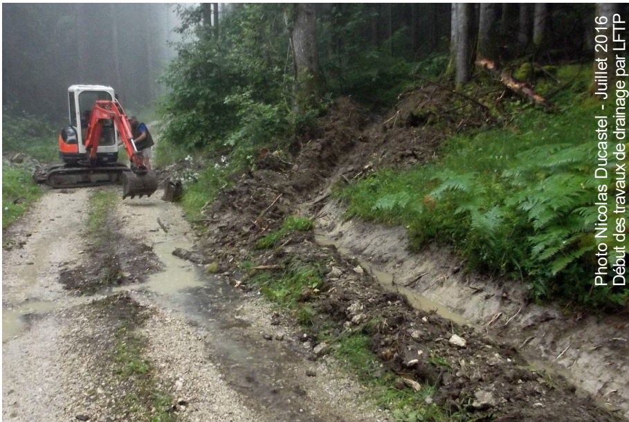
Juillet 2016 Début des travaux de drainage par LFTP

Conformément à ce qui était demandé à la commune par les services de l'Etat (L'Air du Temps n°154), les travaux de drainage du terrain du Bécha ont été réalisés en juillet et validés par l'organisme missionné, Alpes-Géo-Conseil. Nous sommes maintenant en attente de la modification de la carte des risques naturels pour pouvoir passer aux phases suivantes : viabilisation et commercialisation des 8 lots.