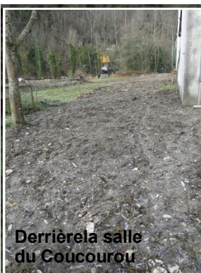
Derrière la salle du Coucourou

Derrière l'école (photo de gauche), la remise en état du terrain sera effectuée lorsque le bâtiment sera raccordé au réseau et que la fosse septique aura été mise hors service.