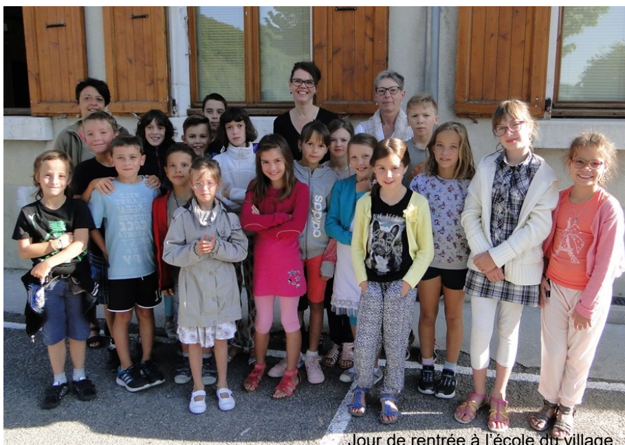
Jour de rentrée à l'école du village

La commune de Rencurel, Les Amis des Coulmes, Le Centre des Coulmes, l'Association de Coordination Culturelle du Royans et tous leurs partenaires vous attendent les 17 et 18 septembre Voir p. 8 et 10