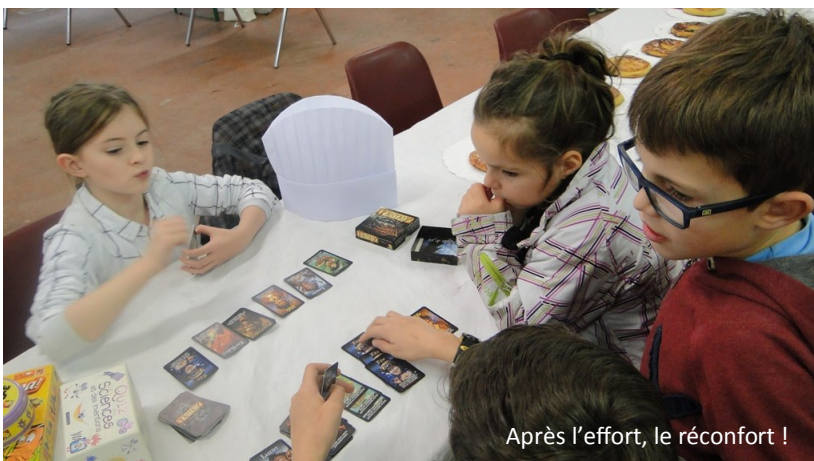
Après l'effort, le réconfort !