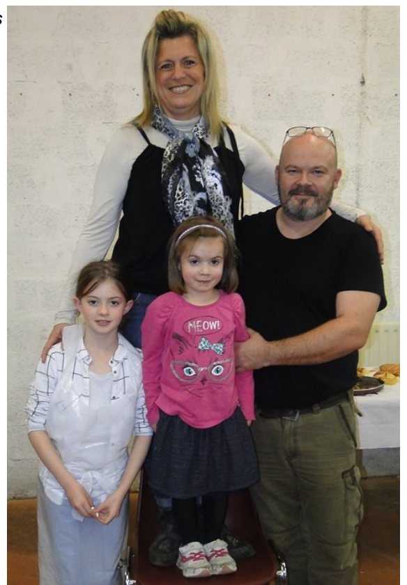
Le podium du concours de galettes :