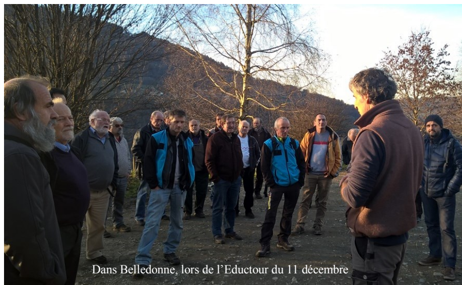
Dans Belledonne, lors de l'Eductour du 11 décembre

A brève échéance, il s'agit de permettre la transmission d'exploitations dans des conditions aussi bonnes que possible tant sur le plan de la viabilité économique que sur les conditions de travail. Il en va du dynamisme de la commune.