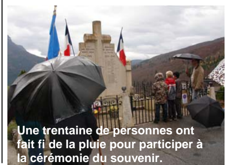
Une trentaine de personnes ont fait fi de la pluie pour participer à la cérémonie du souvenir.