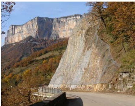
Le rocher du Colombarier emmaillotté !